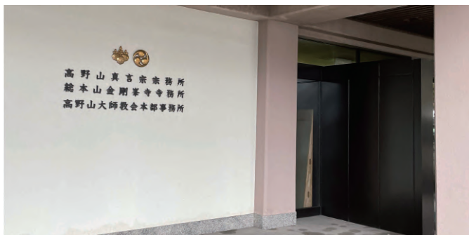
▲高野山真言宗 宗務所入口