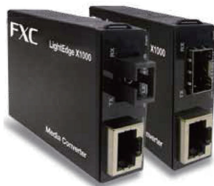
LEX1841シリーズ (1芯タイプ) LEX1841-1F (SFPタイプ)